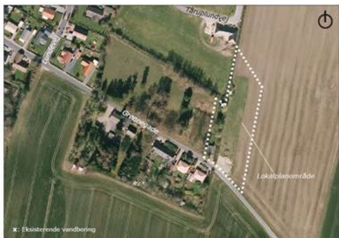
Lokalplanområdets placering ved Grønnegade i Gelsted.