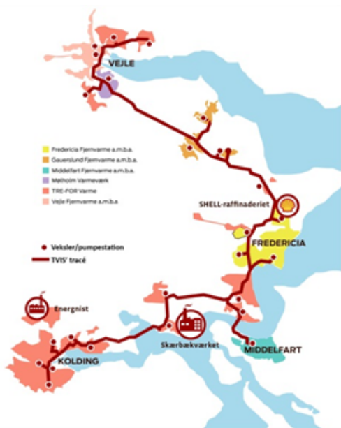
Fig. 2: Transmissionsnettet i Trekantområdet

TVIS driver 83 km transmissionsledning, 29 varmevekslerstationer samt 5 pumpestationer og leverer varme til 183.000 borgere svarende til 83.000 husstande i Trekantområdet.