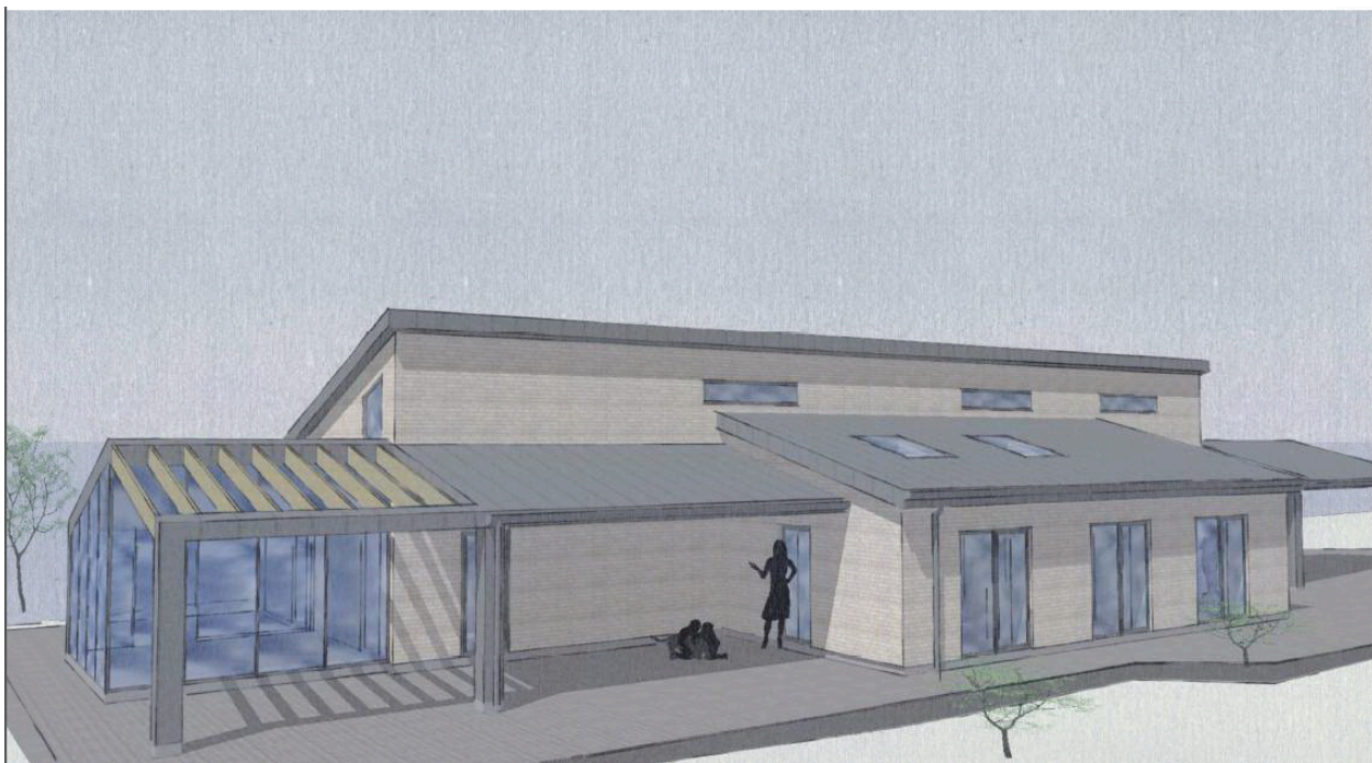
Skitse af det ønskede enfamiliehus.

Der kan efter planlovens § 35 stk. 1 meddeles tilladelse til udskiftning af enfamiliehus i landzone, hvis de placeres inden for ca. 20 meter fra det eksisterende hus, forudsat at den nye placering ikke bliver mere dominerende end den hidtidige placering. Der kan desuden i særlige tilfælde gives tilladelse til, at huse udskiftes med en placering længere væk end de 20 meter. Det kræver som oftest, at der ikke er modstridende interesser som f.eks. naturbeskyttelsesloven eller kommuneplanens retningslinjer om særlig geologisk beskyttelsesområde, værdifuldt landskab eller lignende.