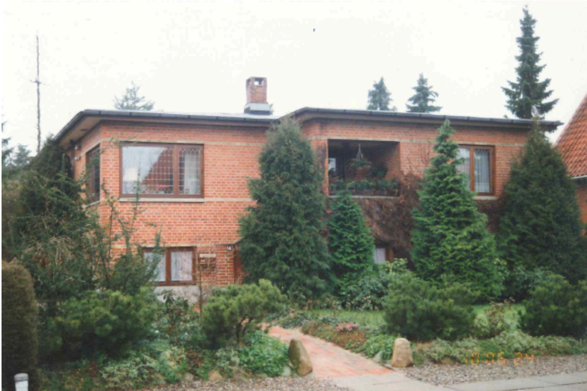
Billede af huset fra 1993