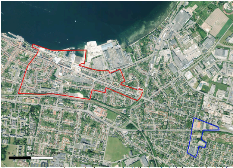
Figur 1: Kommuneplanens skitserede afgrænsning af Middelfart bymidte (red) afgrænsning udvidelse (blue)