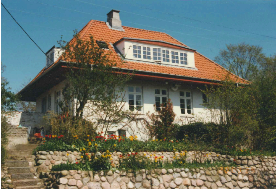
Foto fra 1993 af eksisterende hus