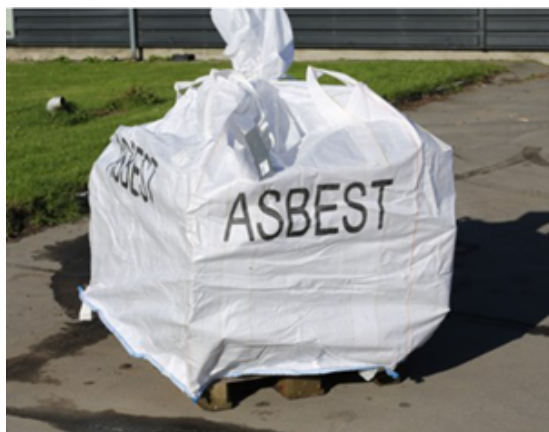
Figur 1 Eksempel på emballering af asbestholdige eternittagplader i big bags

Til bestilleordningen skal anvendes egnede big bags, der sælges på genbrugspladsen. Samtidig med salg af big bags udleveres en vejledning, der beskriver, hvordan asbestaffald skal pakkes, og hvordan der bestilles afhentning af big bagsene. Figur 1 viser et eksempel på emballering af asbestholdige eternittagplader i big bags.