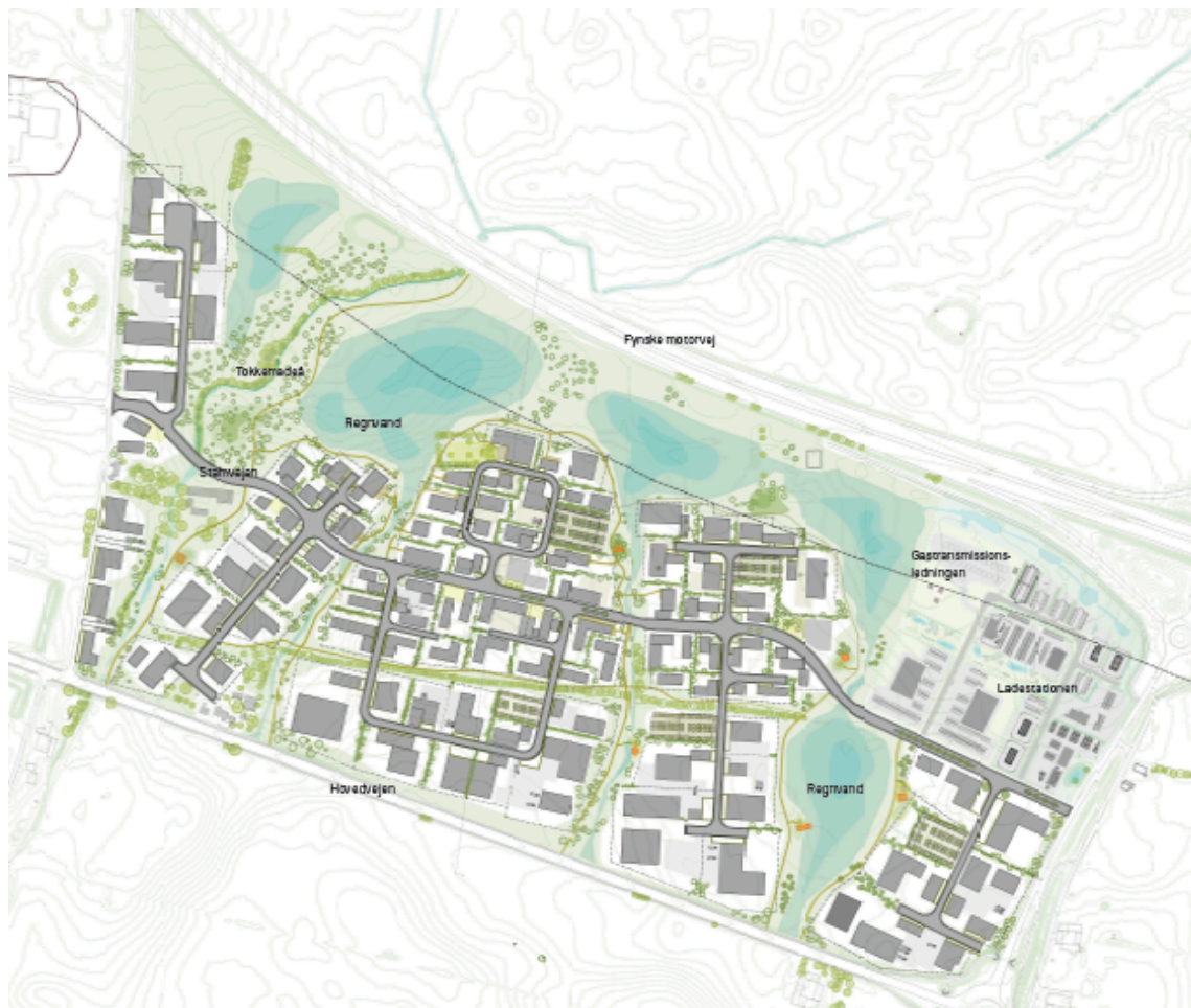
Illustration af Middelfart Ø