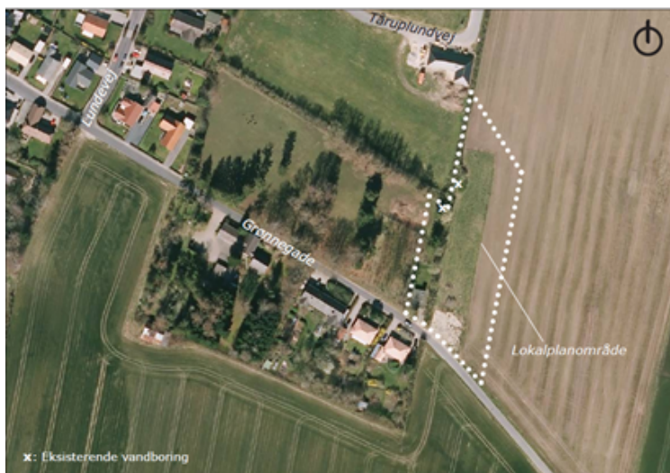
Lokalplanområdets placering ved Grønnegade i Gelsted.

Planforslagene er screenet efter lov om miljøvurdering af planer og programmer og af konkrete projekter (VVM). Det er vurderet, at der ikke var behov for at udarbejde en egentlig miljøvurdering. Afgørelsen er offentliggjort samtidig med planforslagene.