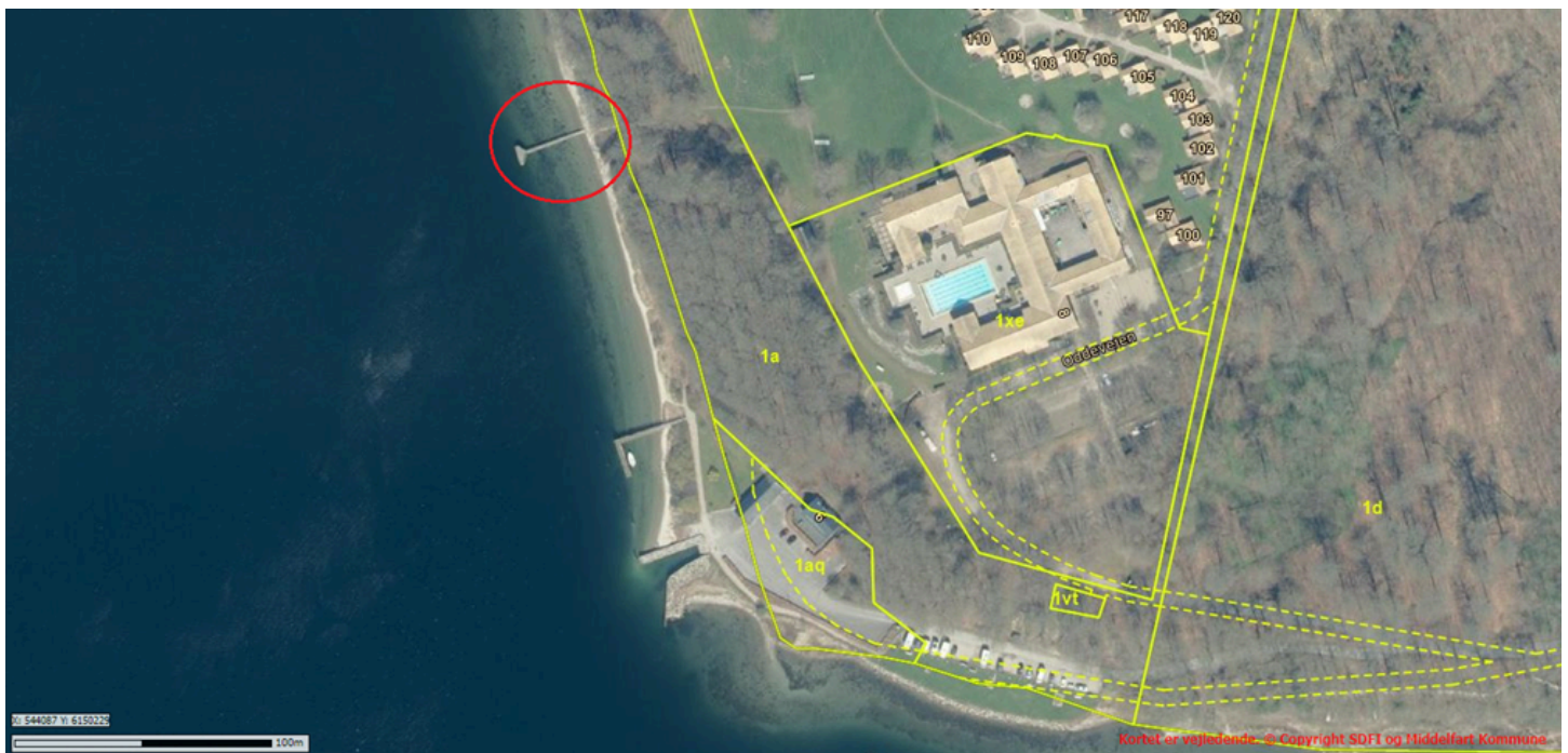
Figur 1: Placering af den ansøgte helårsbadebro ud for matr.nr. 1a Hindsgavl, Middelfart Jorder (rød).

Broen ligger på en kommunalt ejet matrikel, som vist på nedenstående luftfoto (Figur 1).