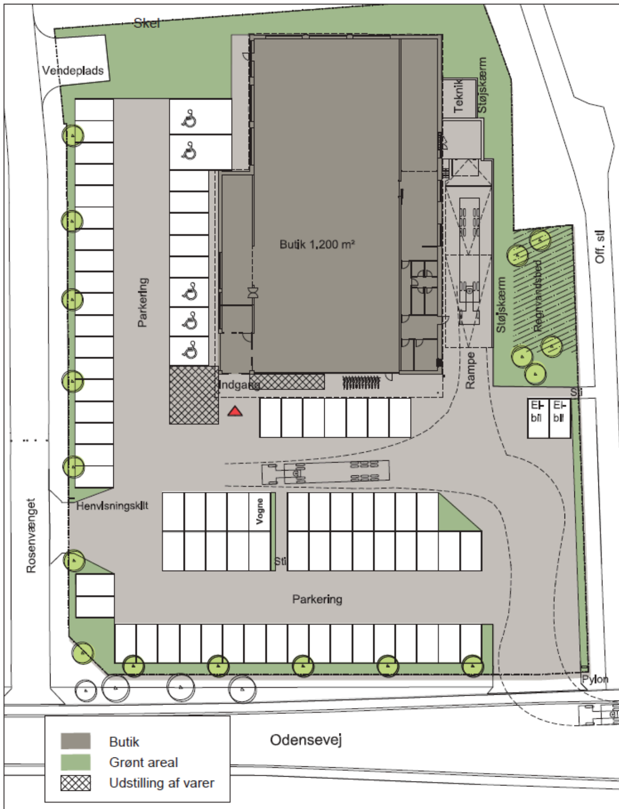
Luftfoto der viser bymidten afgrænset med rødt og aflastningsområdet med blåt.