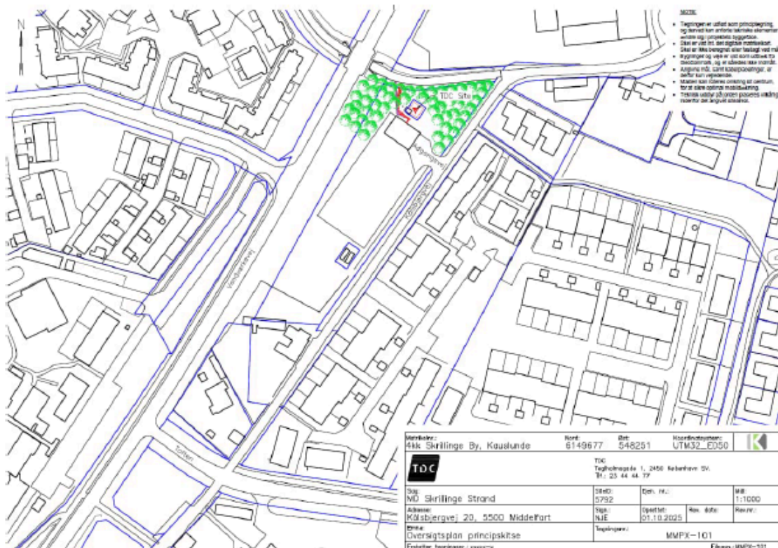
Figur 1 Placering på matrikel